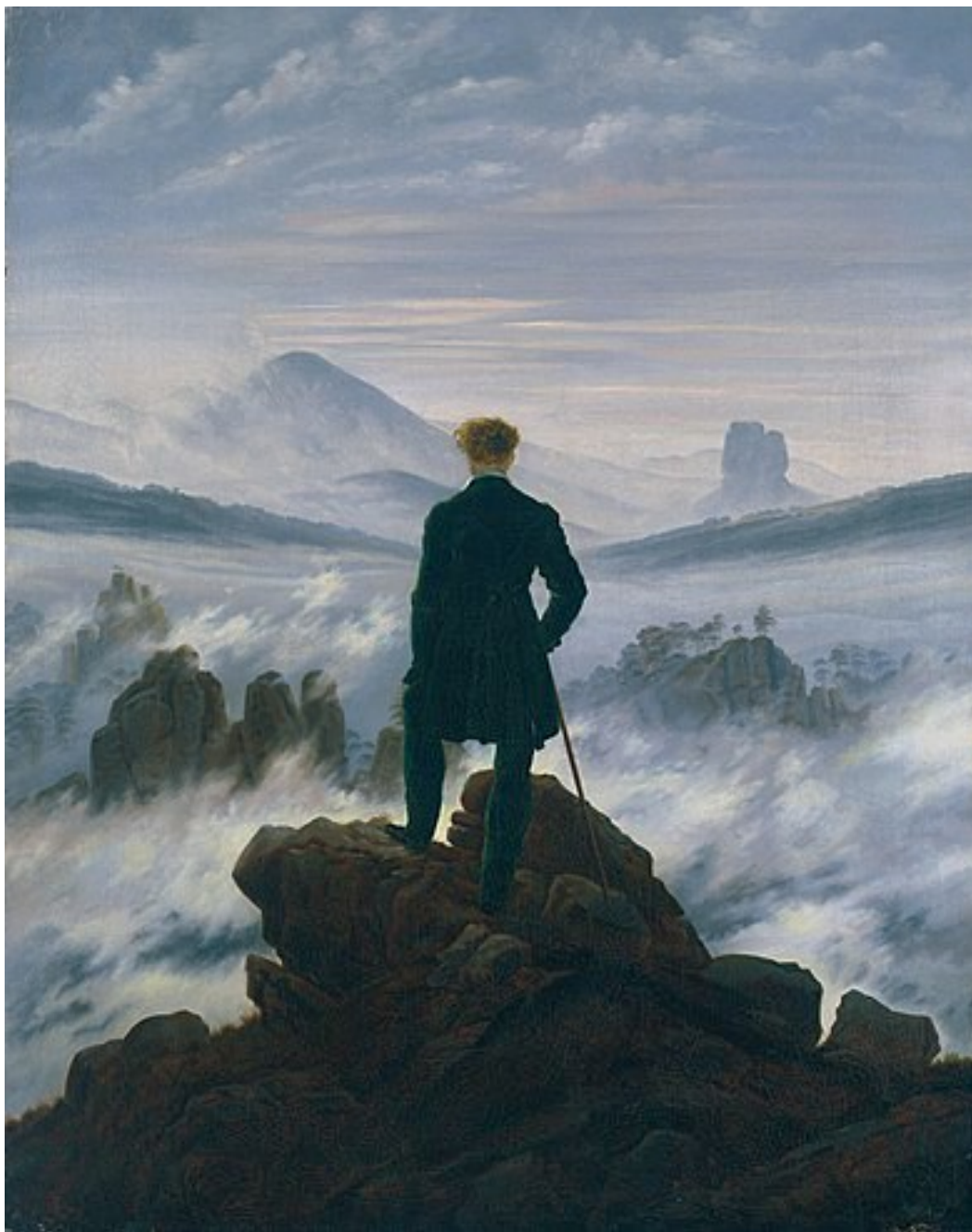
Viandante sul mare di nebbia

Caspar David Friedrich, 1818, Olio su tela, 74,8 x 94,8 cm, Amburgo, Kunsthalle.